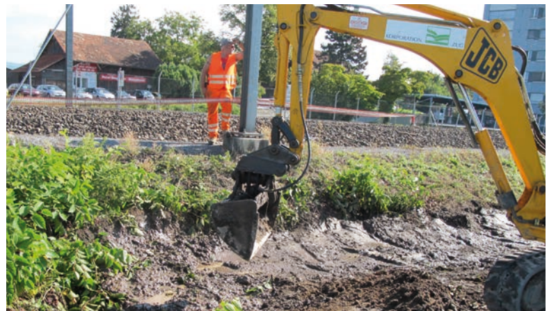
Ausbaggerung von Japanischem Staudenknöterich