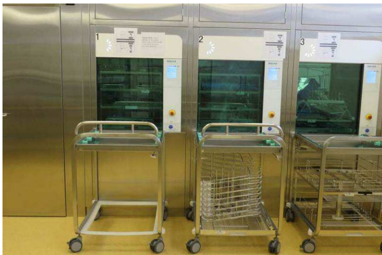
Abbildung: Zentralsterilisation Spitalverbund AR, Herisau

Die Empfehlung bezieht sich auf mengen- und abwasserrelevante Anwendungen von Desinfektionsmitteln im Gesundheitsbereich (Spitäler, Kliniken, Arztpraxen, Pflegeheime etc.) sowie in Lebensmittel verarbeitenden Betrieben (Milch, Fleisch, Getränke etc.). Sie dient den Betrieben als Hilfsmittel für den Ersatz von potentiellen Problemstoffen, ersetzt jedoch die detaillierte Risikobeurteilung im Einzelfall nicht. Nutzerabhängige Dosierung, Wirkung von Stoffmischungen, Eliminationsleistung der betroffenen Kläranlage und Regenwasserentlastungen sind beispielsweise nicht mitberücksichtigt. Gesundheitsgefahren (z.B. krebserregende, giftige oder ätzende Wirkungen) sowie physikalische Gefahren (Explosion, Korrosion, Entzündlichkeit) sind ebenfalls nicht Gegenstand dieser Beurteilung.