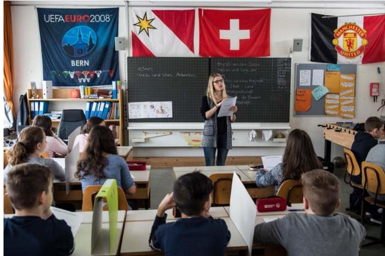
Eine Studentin während ihres letzten Praktikums an einer Schule in Thun, Kanton Bern.